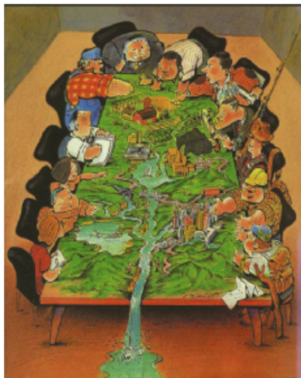
Det er mange brukerinteresser i vassdraget

Hyppige algeoppblomstringer i Mjøsa på 60- og 70-tallet førte til en rekke problemer for brukerne av vannet. Ved gjennomføringen av de to Mjøsaksjonene på 70- og 80-tallet ble vannkvaliteten i Mjøsa betydelig forbedret. Tiltakene var rettet mot kommunalt avløp, landbruk og spredt bosetting. På 70-tallet startet man å systematisk overvåke vannkvaliteten i Mjøsa med tilløpselver. Det ble gjennomført årlige undersøkelser, og slik fikk vi dokumentasjon på endringene i vannkvaliteten før, under og etter Mjøsaksjonen. Overvåkingen gjennomføres i dag av Vassdragsforbundet for Mjøsa med tilløpselver . Den biologiske/økologiske tilstanden i Norges største innsjø karakteriseres nå som nær akseptabel. Selv om Mjøsaksjonene har gitt gode resultater, er det fortsatt behov for et sterkt fokus på forurensningen av vassdraget.